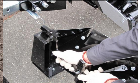
成形部【ワンタッチ装着】