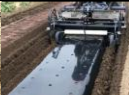
SD型に別売のマルチキットをセットした作業