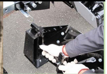
成形部 カチャスポ脱着