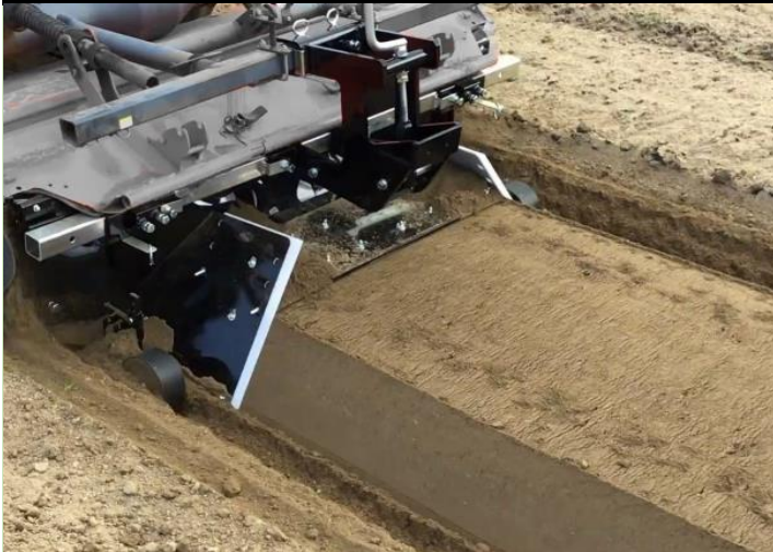
SD型での平高うねたて作業